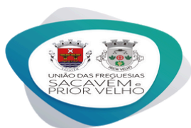
DEFORMAÇÃO DO LOGÓTIPO

Aqui apresentamos as incorreções mais frequentes.