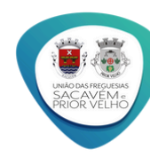
EXCLUSÃO DE ELEMENTOS